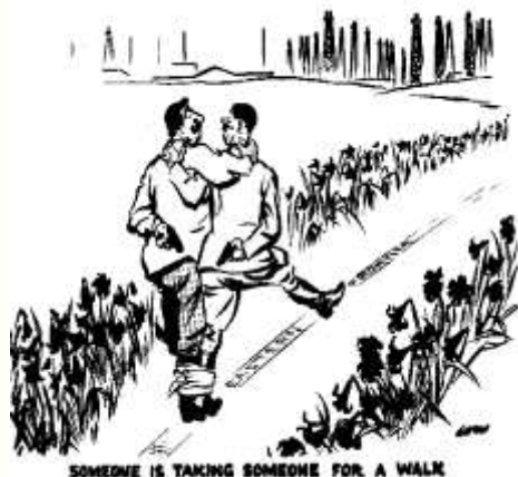
SOMEONE IS TAKING SOMEONE FOR A WALK